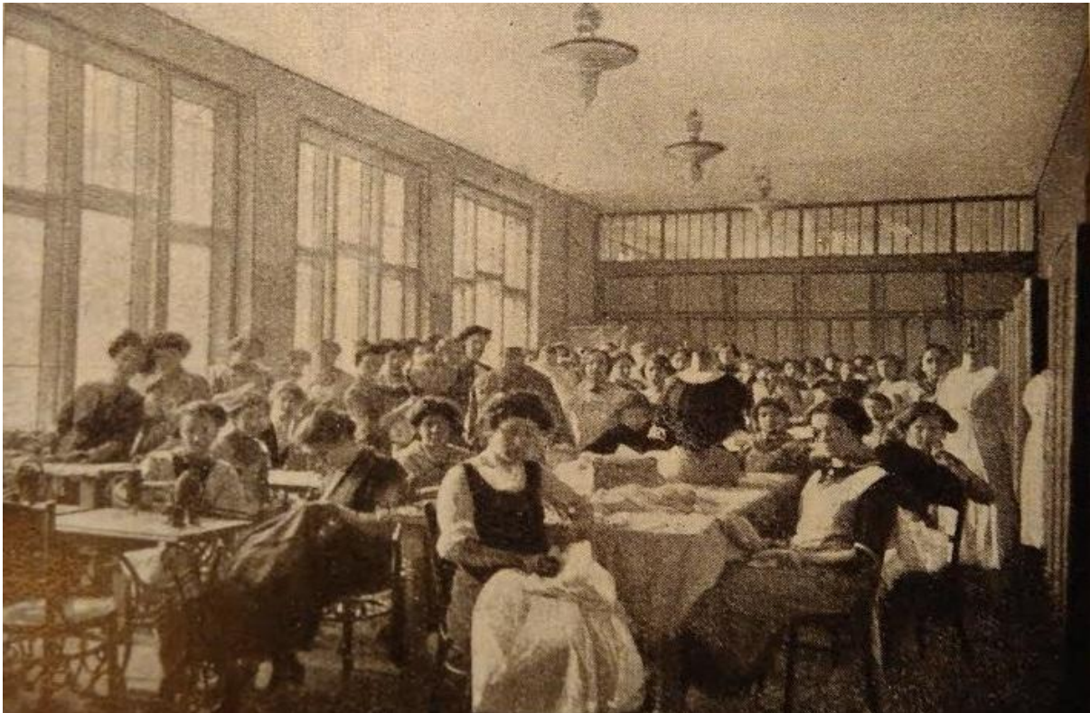
Nőiipariskola tanterme. In.: Víg Albert: Magyarország iparoktatásának története az utolsó száz évben különösen 1867 óta. Bp., 1937.

gazdasági célokra szolgáló helyiségek (pl. fáskamra). Az udvarra külön bejárat vezet az épület baloldali sarkában, a magasföldszint alatt.