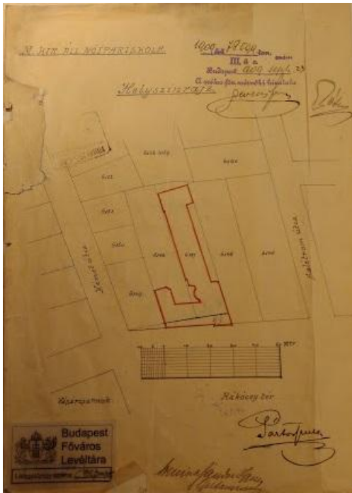
1909-es Helyszínrajz. Budapest Főváros Levéltára.