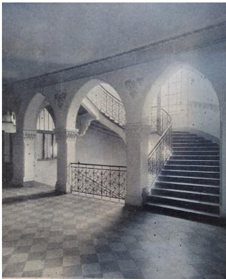
Előcsarnok. In.:Ép1913 23. szám. 250. oldal

A főbejáratától balra a tér felőli oldalon, a földszinten eredetileg az igazgató lakása került kialakításra, az udvar felé az igazgatói iroda és egyéb adminisztrációs helyiségek.